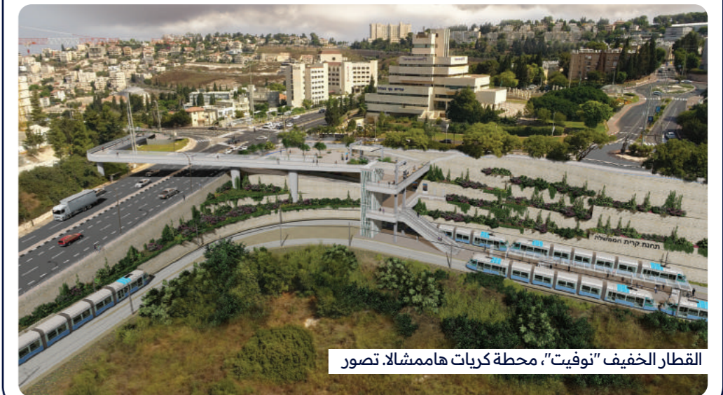
القطار الخفيف "نوفيت"، محطة كريات هاممشالا، تصور